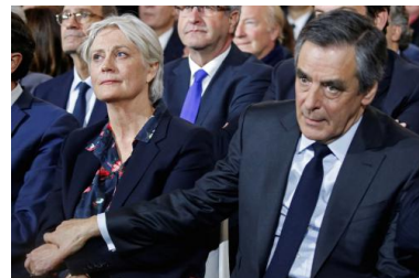
Le couple Fillon au meeting de la Villette

Vous l'adorez, le clown Jean-Christophe Cambadélis : il n'hésite pas à mettre en doute publiquement l'honnêteté de Fillon alors qu'il a lui-même été condamné deux fois par la justice dans des affaires d'emplois fictifs ! [ rires unanimes ]