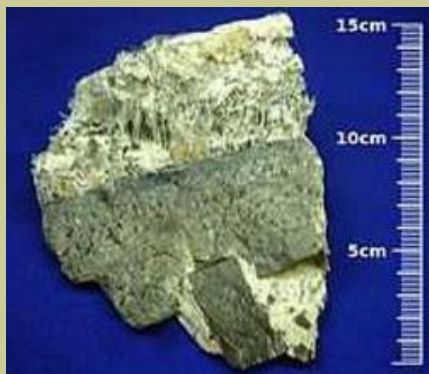
Amiante selon Wikipédia

(La présente annexe est incomplète et correspond à des extraits d'une version qui sera présentée ultérieurement)